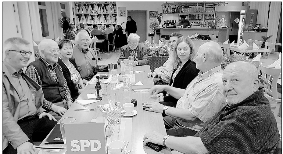
Die Genossen auf der Suche nach der Doppelspitze für die SPD.