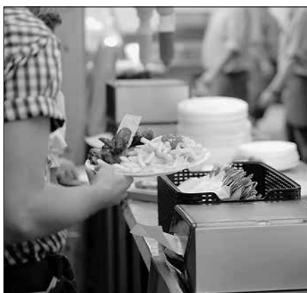
Für Speisen und Getränke zum Thema „Oktoberfest“ ist gesorgt.

mit Amrichshausen, Belsenberg, Gaisbach, Garnberg, Kocherstetten, Laßbach, Morsbach, Nagelsberg, Nitzenhausen, Steinbach, Taläcker