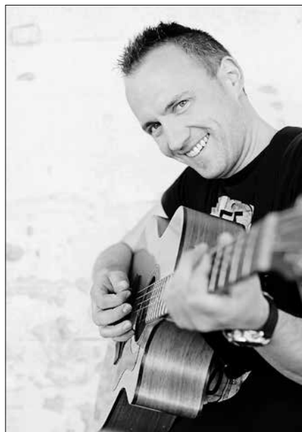
Kinderliedermacher Mike Müllerbauer tritt beim Kindertag POPCORN auf.

Veranstaltet wird der Kindertag POPCORN vom CVJM Künzelsau zusammen mit der Evangelischen Kirchengemeinde Künzelsau, der Katholischen Kirchengemeinde Künzelsau, der Süd-deutschen Gemeinschaft Künzelsau und dem Jugendwerk Künzelsau.