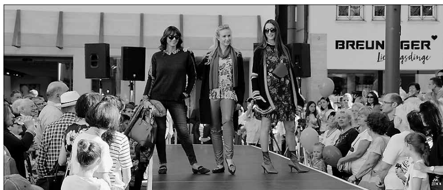
Die beliebte Herbstmodenschau findet am Sonntag am Alten Rathaus statt.