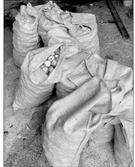
Bei der Sammelaktion füllten sich einige Säcke mit Äpfeln.

Traditionell umgeben Streuobstbäume die Ortschaften und begleiten häufig Wege und Straßen. Als Kulturpflanze bieten Streuobstbäume zudem regionale und saisonale Lebensmittel, deren Wertschätzung in der Gesellschaft mit dieser Sammelaktion gestärkt werden soll. Die Stadtverwaltung Künzelsau möchte der Vergeudung wertvoller Nahrungsmittel entgegenwirken. Auch der Mostverein Nagelsberg unterstützt die Nutzung der Streuobstwiesen. Bis Ende Oktober kann dort jeden Samstag eigenes Obst zu Most verarbeitet werden.