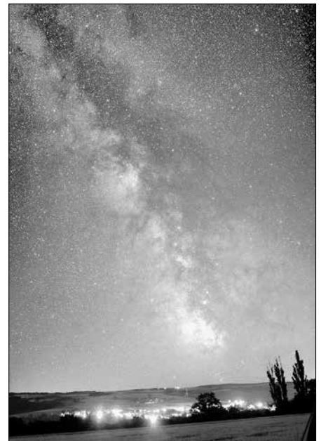
Unsere Milchstraße über Hohenlohe.

Der Eintritt zu beiden Vorträgen ist frei. Eine Anmeldung ist nicht erforderlich.