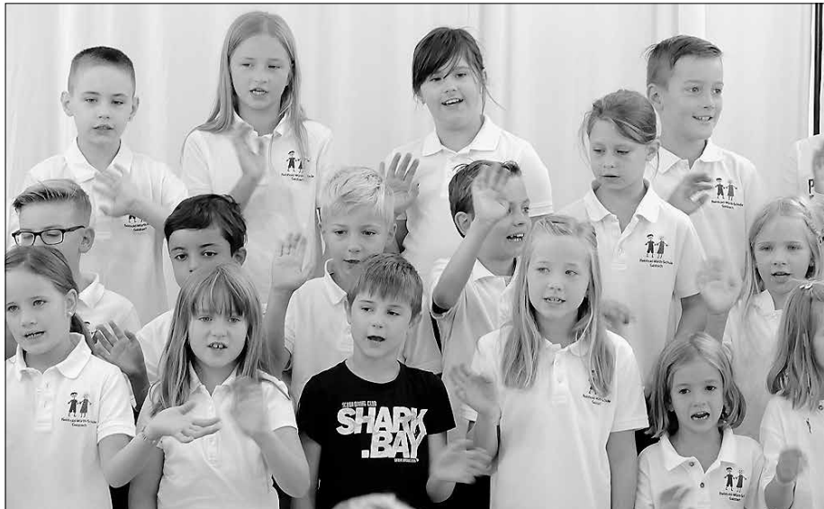
Aufführung bei der Einschulungsfeier der Reinhold-Würth-Grundschule.