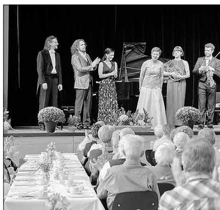
Musik am Nachmittag: Sich treffen, gemütlich sitzen, Musik hören und Kaffee trinken.